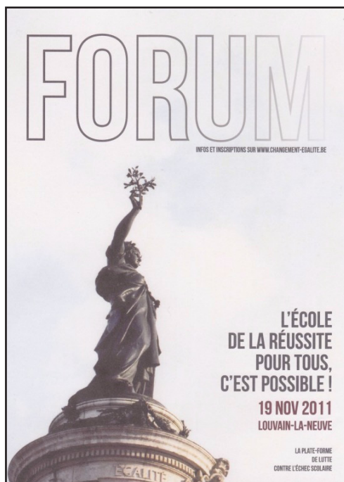
Table-ronde sur la laïcité et l'école

Infos ? www.changement-egalite.be (date limite d'inscription : le 15 novembre) Participation : 6€ par virement ou 8€ sur place (café et drink compris).